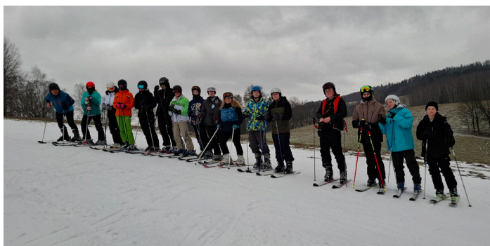
II. stupeň na lyžařském výcviku