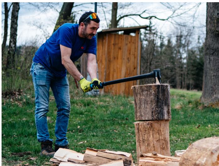
Příprava čarodějnic

Vážení čtenáři, vstoupili jsme do měsíce dubna, který, jak všichni doufáme, bude již plně jarním měsícem. Nejdříve však malé ohlédnutí za uplynulou první čtvrtinou letošního roku.