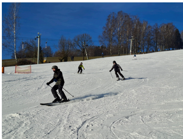
II. stupeň na lyžařském výcviku