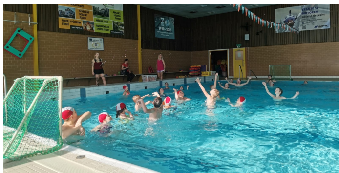
I. stupeň na plaveckém výcviku