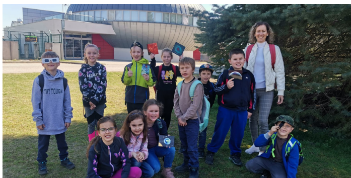
I. a 2. ročník u hvězdárny v Hradci Králové