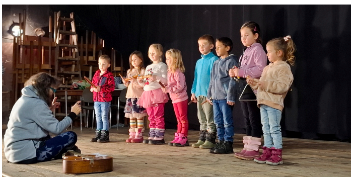
Děti z MŠ na vánoční akademii