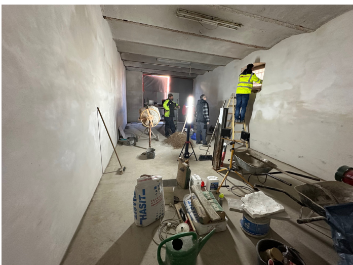
Rekonstrukce garáže / kotelny za radnicí