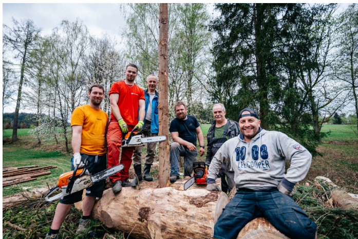
Část stavitelů na hranici

V letošním roce slavíme již 30. ročník stárkovských čarodějnic. V pátek 18. dubna stavitelé postavili hranici a v týdnu naše pekařky napekly perníčky. Žáci ZŠ Stárkov v úterý uklidili horní hřiště. Všem za pomoc děkujeme.