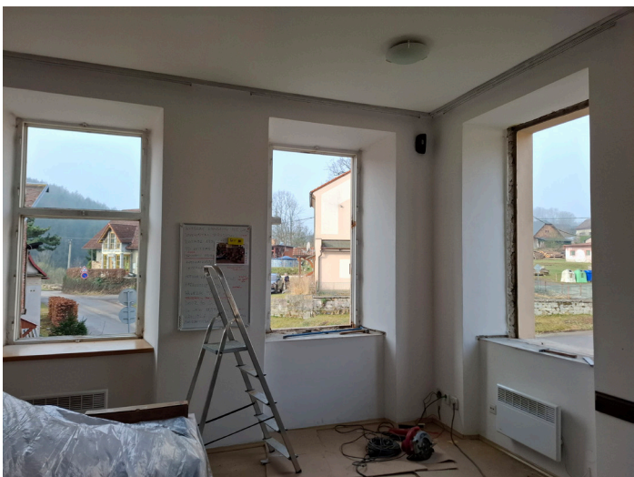
Kancelář starosty při výměně oken

Hned na začátku ledna jsme zahájili práce na výstavbě ordinace pro naši paní doktorku v budově radnice. Jelikož se jedná o kompletní přestavbu celého přízemí, výměnu oken a nového topení v celé budově, museli jsme zajistit