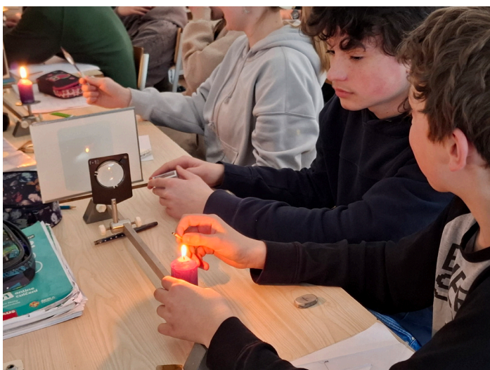
8. a 9. ročník při hodině fyziky