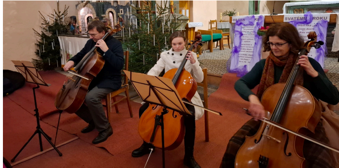
Předehra před Betlémským světlem