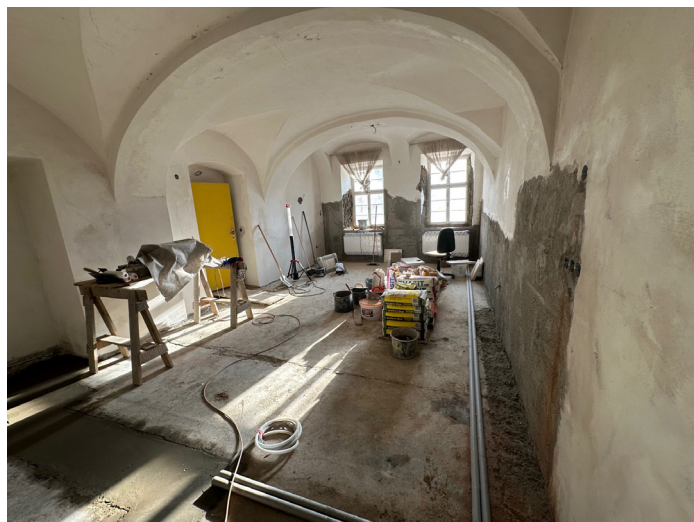
Rekonstrukce radnice