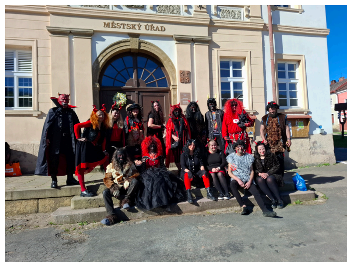
Čerti před radnicí čekají na autobus.

O velikonoční neděli vyjeli naši čerti a čertice na návštěvu do pekla u Hlinska – Čertoviny. V příštím zpravodaji se můžete těšit na reportáž. Zatím přinášíme fotografii.