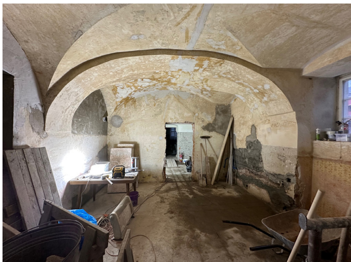
Rekonstrukce radnice