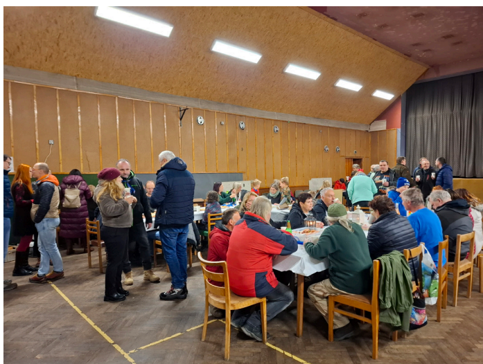
Sousedské posezení v kině