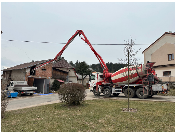
Rekonstrukce garáže / kotelny za radnicí