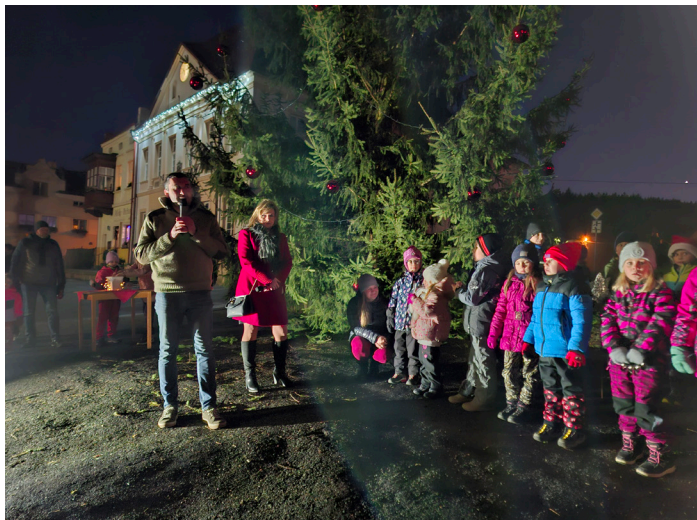
Rozsvícení vánočního stromu