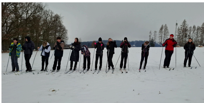
II. stupeň na běžkách