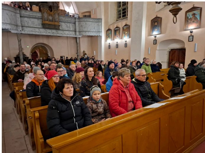
Betlémské světlo v kostele sv. Josefa