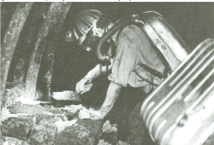
Ruční stěna (O dolování černého uhlí ve Rtyňsko-Bohdašinské oblasti na Jestřebích horách, str. 136)

JB: Dokonce jezdily takové autobusy, speciální kukaně. To ale až