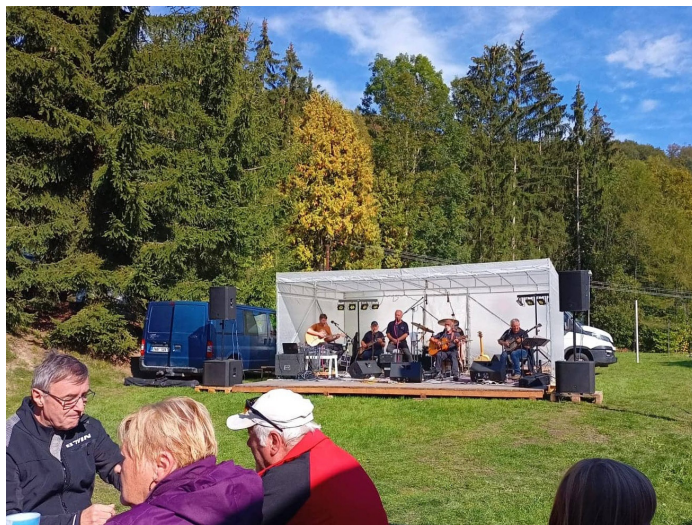
Odpolednem provázela hudební skupina Slaveňáci.

Novinkou byly trasy v elektronickém formátu, který si každý mohl stáhnout z webu www.kt30.cz .