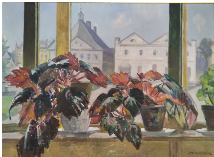
Při pobytu ve Stárkově se paní malířka stravovala v pohostinství Jednota u Prachařů. A tam právě vzniknul tento obraz. Není datován.

měla v Praze ateliér. Když p. malířka bydlela ve Stárkově, intenzivně pracovala. Chodila kolem nás malovat ke kapličky. Zdravil jsem ji a krátce pohovořil, ale nikdy mě nenapadlo vzít foťák a ji při práci vyfotografovat. Byla to už starší dáma, ale statečně nesla stojan a další malířské potřeby až nahoru. Luční kvítí, to bylo její doménou.