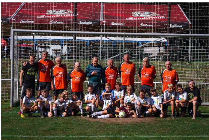
Stará garda 60+ a Naděje Sokola

Zápasů: 16, Vítězství: 11, Remíza: 0, Prohra: 5 Skóre: 109:97, Průměr na zápas: 6,81:6,06